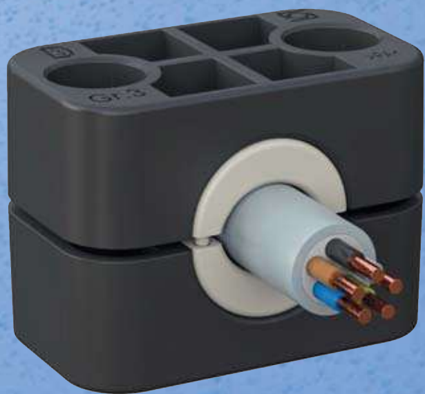
Generell lassen sich Kunststoffschellen unterschiedlicher Bauart auch für den Schutz beziehungsweise die Führung von elektrischen Leitungen und Kabelbündeln einsetzen.

Über die weitverzweigten Leitungen breiten sich diese Geräusche nicht nur im Hydrauliksystem aus, sondern verstärken sich noch, indem sie weitere Systemkomponenten und – bei starrer Befestigung – auch angrenzende Bauteile in Schwingung versetzen. In Luftschall umgewandelt, erreichen sie dann als unangenehmes Dröhnen das menschliche Ohr. Einen entscheidenden